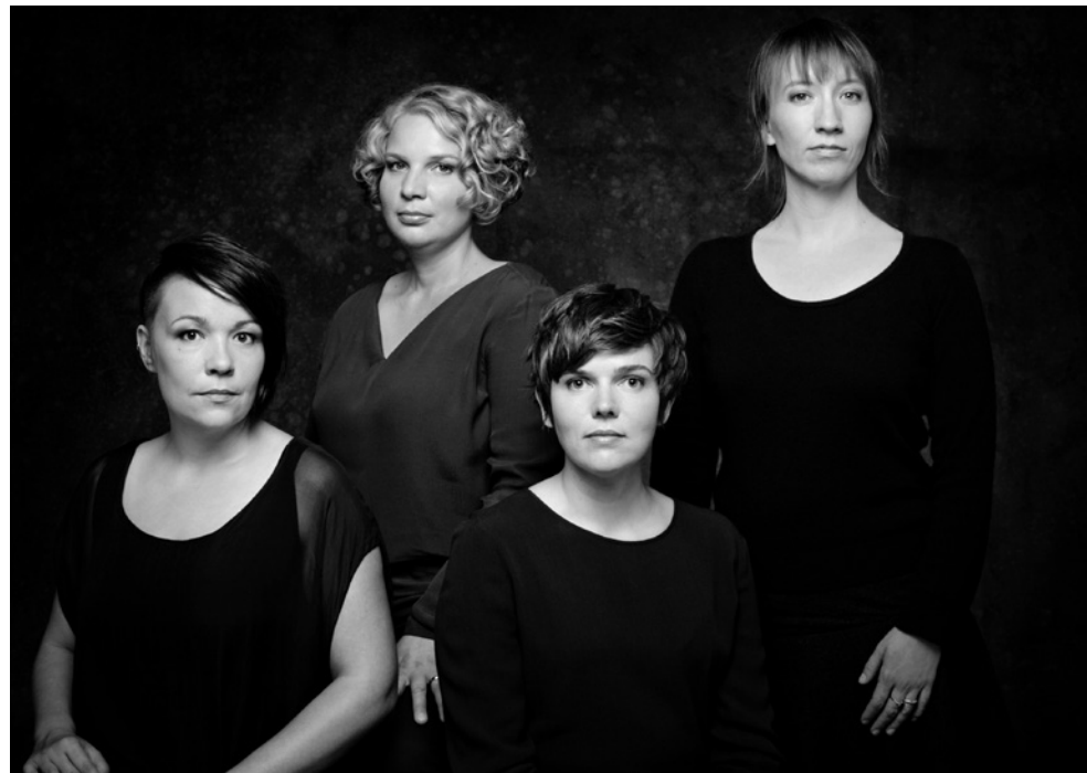
A -Cappella-Festival / Niniwe / 30. November 2019