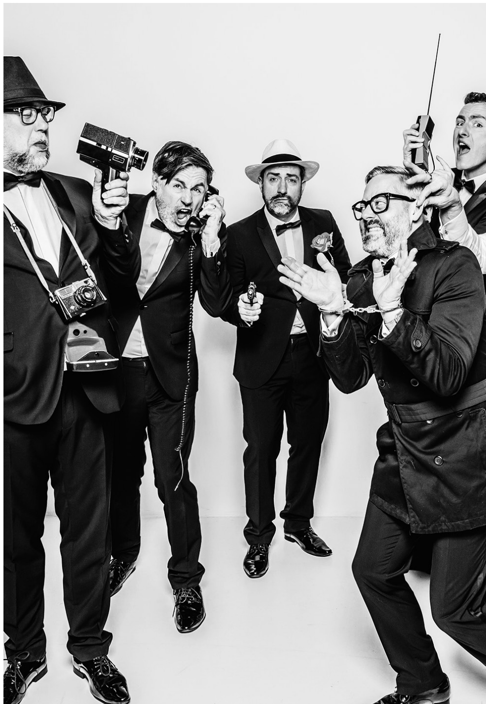
Six Pac / 25. Mai 2019