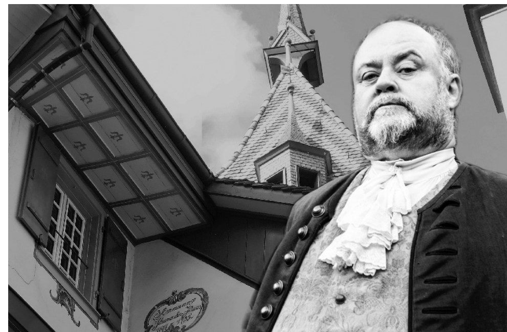
50 Jahre Burgbachkeller / De schwarz Schumacher / Zuger Spiillüüt / 18. Januar 2019

14. MÄRZ: Premiere und weitere 18 Aufführungen der SCREAMING POTATOES im Burgbachsaal IM DSCHUNGEL . Unerschrocken und furchtlos, das waren sie schon immer, die Screaming Potatoes. Den Weltraum haben sie in ihren Bühnenprogrammen erforscht und die hohe See befahren: kein Weg war ihnen zu weit, kein Ort zu abgelegen – immer das eine Ziel vor Augen: die Zuhörer und Zuschauerinnen mit (meist) feinem Humor und (oft) gepflegtem Gesang zu erfreuen. Diesmal geht es ab in den Dschungel, in die Abgründe der männlichen Seele, ins Herz der Finsternis: die eigene Familie. Wie immer erweisen sich die Potatoes als Meister der kultivierten Banalität, die souverän jede Klippe des