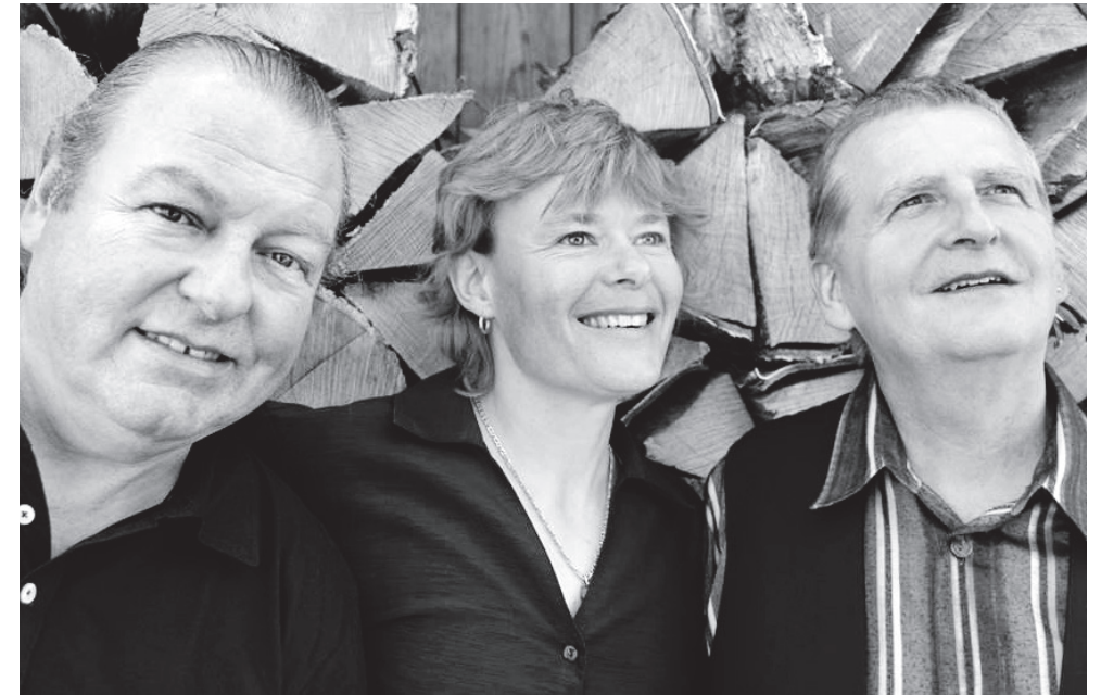
Arte Rumori / 24. Mai 2019