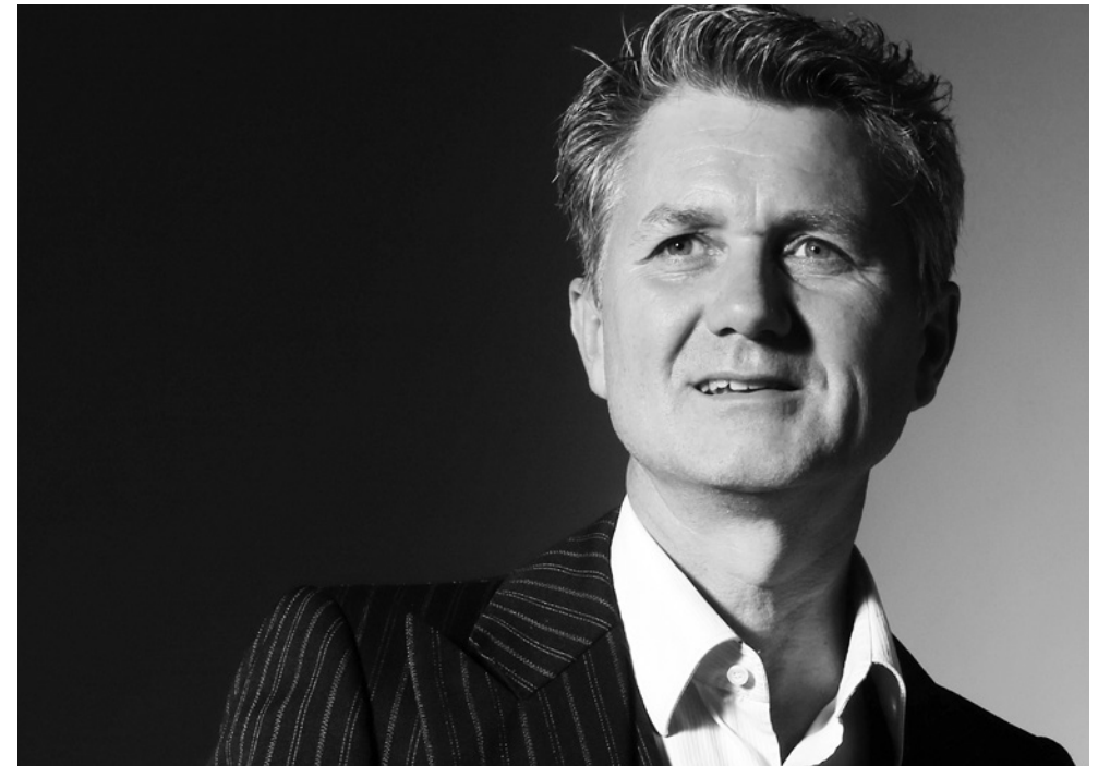
Volker Ranisch / 12. Dezember 2019